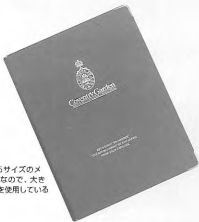
商談中はA5サイズのメモでは失礼なので、大きめのノートを使用している