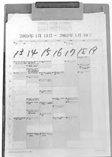
スケジュールはアシスタントがコンピュータで管理。それを3週間先までプリントアウトして携帯している